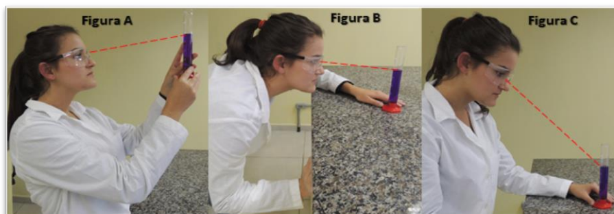
Figura 7. Posições de leitura incorretas do menisco. Figura 7.A- Leitura de volume superior ao mensurado. Figuras 7.B e 7.C – Leituras de volume inferiores ao mensurado.