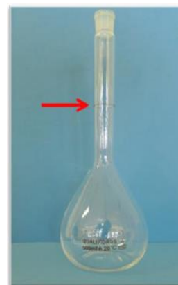
Figura 1. Indicação de Menisco através da seta vermelha em um balão volumétrico.

Para líquidos claros o ajuste de volume na vidraria deve ser feito pela parte inferior do menisco (Figuras 2 e 4), já para líquidos escuros, pela parte superior (Figuras 3 e 5) Algumas vidrarias não apresentam o menisco.