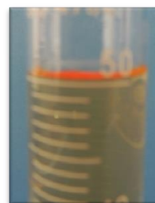
Figura 4. Menisco em líquido Claro.