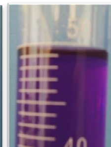
Figura 5. Menisco em líquido escuro.

O menisco deve ser visualizado sempre elevando o frasco até a altura dos olhos (Figura 6), evitando assim o erro de paralaxe (Figura 7).