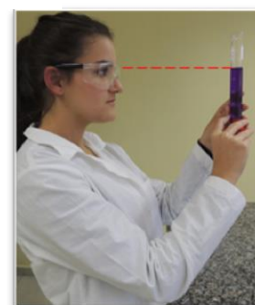
Figura 6. Posição de leitura adequada do menisco.

Erro de paralaxe é um erro que ocorre pela observação errada na escala de graduação causada por um desvio ótico causado pelo ângulo de visão do observador. Interfere principalmente na exatidão de uma análise e na precisão quando há alternância de analistas.